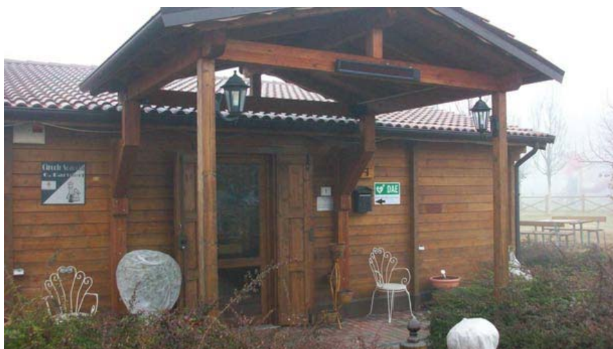
Razzia notturna presso la Comune del Parco di Braida, la casina di legno che funge da sede per l'associazione che gestisce il parco che si estende tra la Circonvallazione, via Braida e via Divisione

17 people like this. Be the first of your friends.